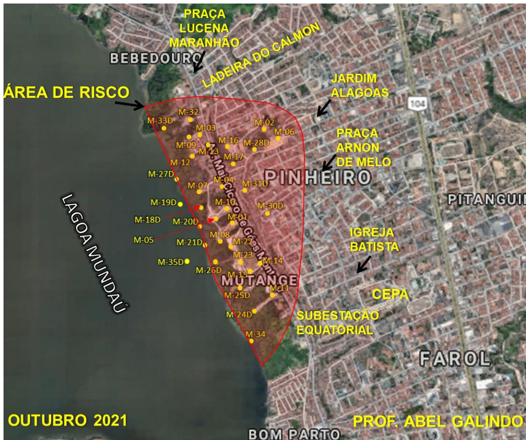
Figura 3 – Novo mapa da área de risco

Esse mapa é fruto da redução das citadas deformações no bairro do Pinheiro nos últimos 12 meses. O raio da linha vermelha, que delimita a área de risco, foi calculado pela fórmula que consta no relatório alemão de dezembro de 2019. O fator de segurança é superior a 2. O que representa um bom F.S.